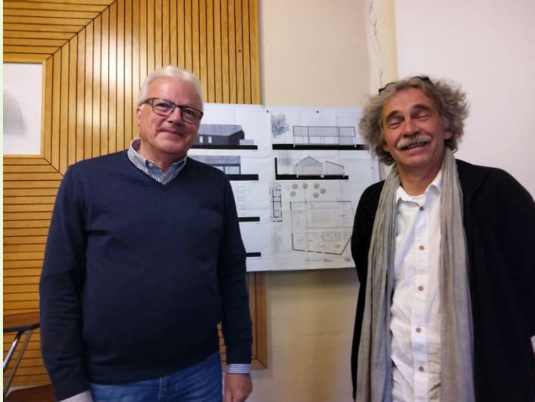
Der notwendige Bau eines Gemeindehauses