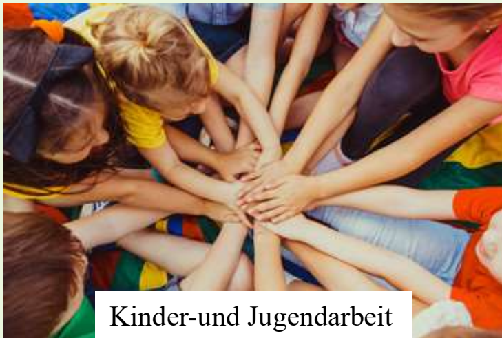
Kinder- und Jugendarbeit