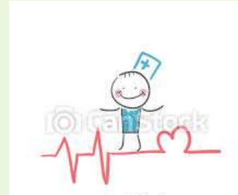
Wiederbelebung der Gemeindegarbeit nach coronabedingten Abbrüchen