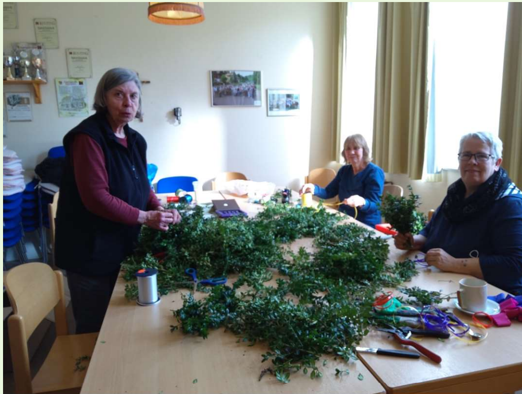
Ostersträußchen werden gebunden